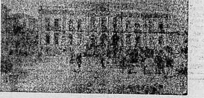
A ESCOLA POLITÉCNICA, EM 1860

Cogita-se de pôr abaixo o edifício da Escola Politécnica para desconsagrar o Largo de S. Francisco de Paula, que nasceu com o nome de Largo da Sé Nova por que nos tempos de antanho ali se pretendia levantar a Sé da Cidade, que depois, devido ao Morro do Castelo, levou muito tempo até encontrar um pouco definitivo.