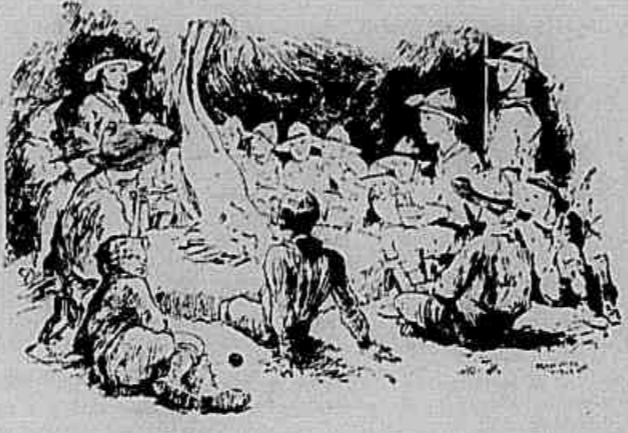
JAMBURI - Um "Fogo do Conselho" numa das tropas escoteiras acampadas