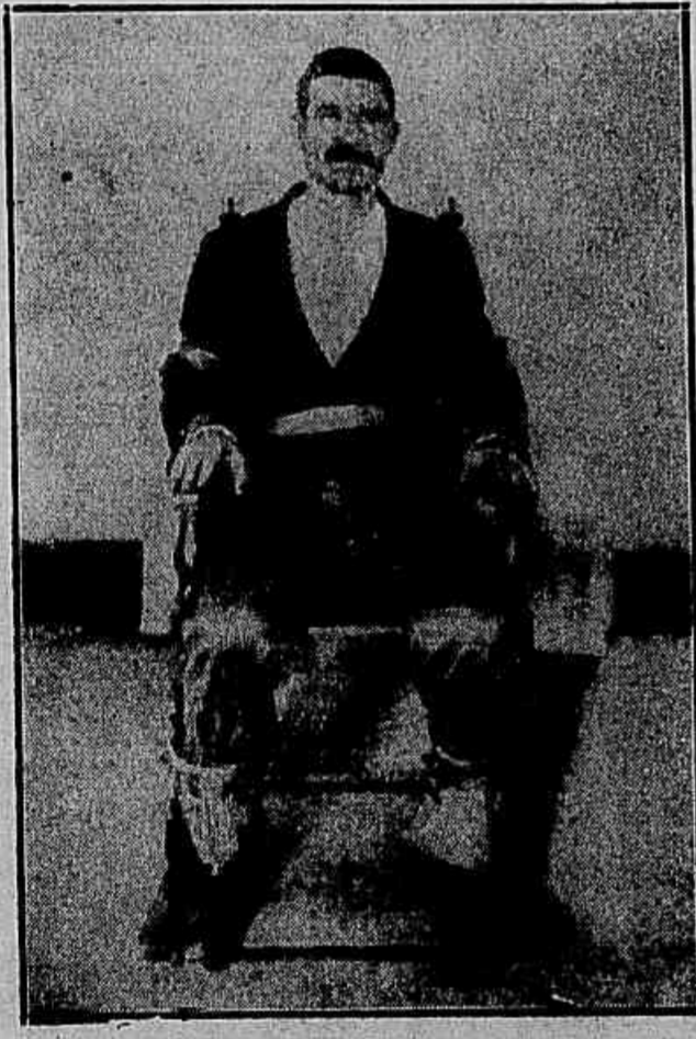
Um louco amarrado na cadeira apropriada, no Centro Espiritista Redemptor

nao de que o Centro se incumbiu de tratar qualquer doente, desde que este assigne um compromisso de seguir rigorosamente as indicações recebidas. De casos mais vulgares são de loucura, para os quizes existem processos especiaes. Os enfermos dessa natureza são internados em quartos apropriados, com grades que impedem a fuga. Para contatos, empregam-se cadeias de couro, applicadas nas mãos e nos pés, estendendo, tambem, cadeiras apropriadas para retilos. Acreditam os adeptos do Centro Redemptor que ad com violencia se consegue afastar do corpo dos obsessões os malos espiritos. Por isso, certo, não de que, no dia da batida policia, os "mediuns" Lomar