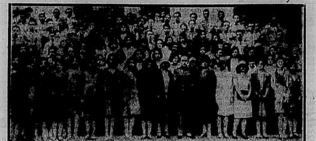
Aspecto apainhado depois da missa em accão de graças...