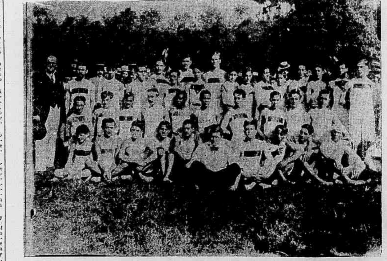
Um grupo de concorrentes que tomou parte na festa de sports athletics realizada com brilhantismo na Quinta da Boa Vista...