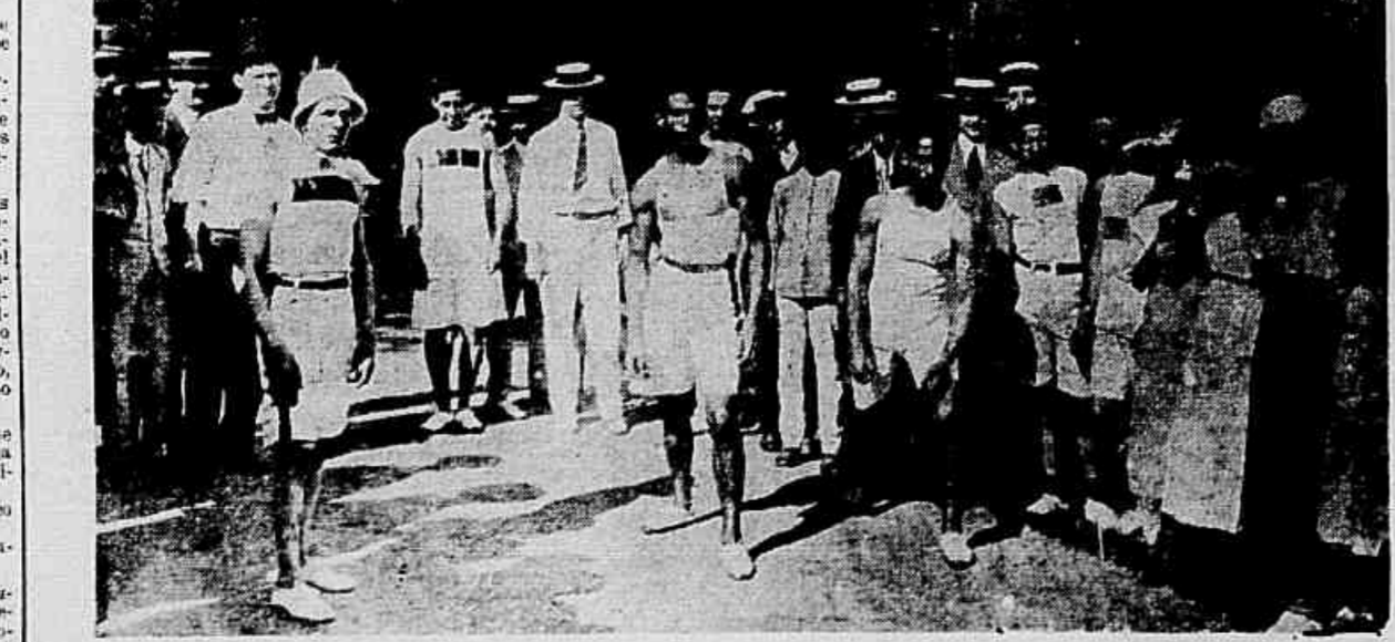
A partida de um dos pares da festa de sports athletics de na Quinta da Boa Vista...