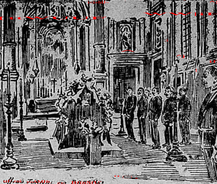
NA CAPELLA DO HOSPITAL DE S. JOSE. Bombeiros do Porto e de Lisboa velando o cadáver do valente chefe dos bombeiros do Porto.

Os médicos diagnosticaram-lhe uma doença aguda, que se desenvolveu com rapidez e com violência. O doente morreu em 12 de novembro de 1902, aos 34 annos de idade. O seu corpo foi velado na capella do Hospital de S. José, e os seus funeraes realizaram-se no dia 14 de dezembro, ás 10 horas da manhã. O cortejo fúnebre saiu do Hospital de S. José ás 10 horas da manhã, e dirigiu-se para a capella do Hospital de S. José, onde se realizou o velório. O cortejo fúnebre foi acompanhado por um grande numero de pessoas, e a missa foi celebrada ás 11 horas da manhã. O corpo foi sepultado no cemitério de S. João de Deus, ás 12 horas da manhã.