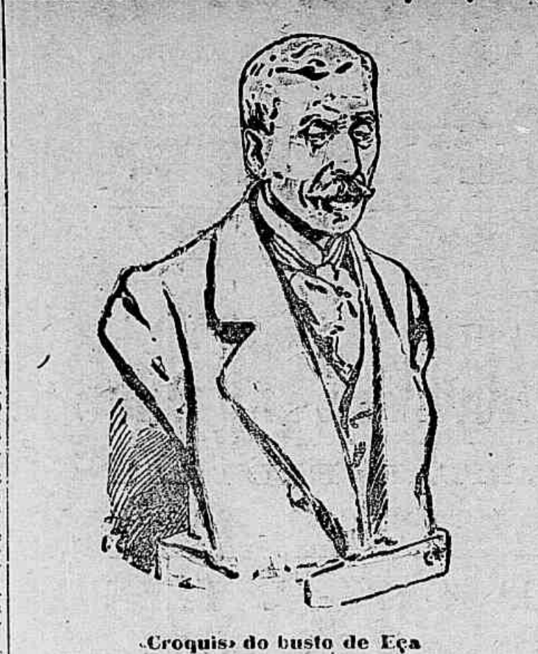
Croquis do busto de Eça