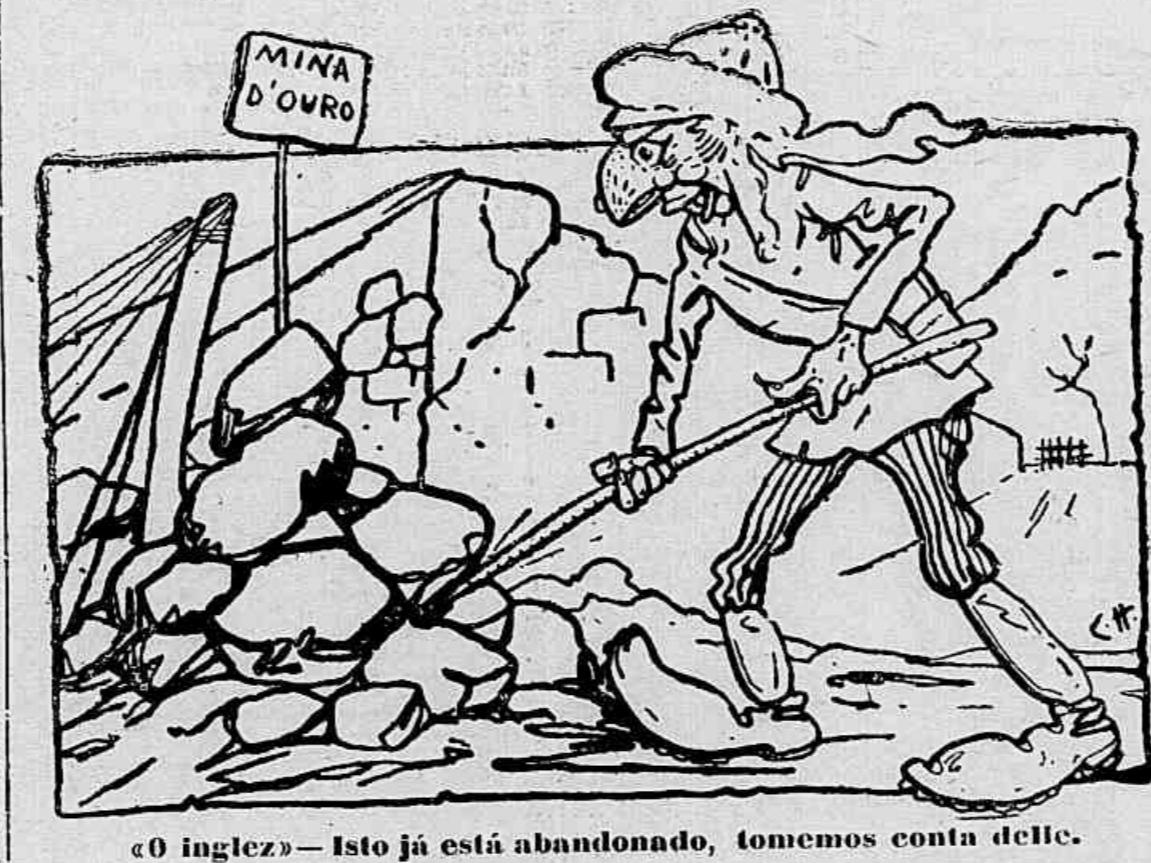
«O inglez» — Isto já está abandonado, tomemos conta delle.