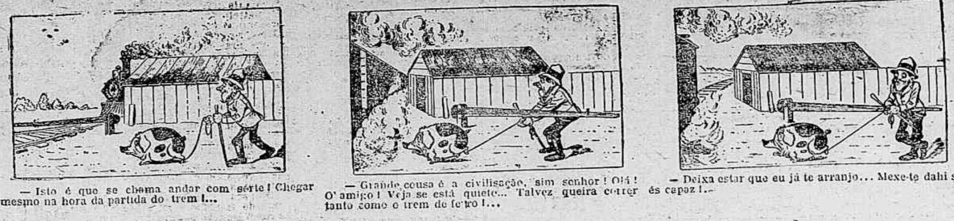
— Isto é a que se chama andar com arie! Chegar mesmo na hora da partida do trem!... — Grande cousa é a civilização, sim senhor! Oh! O amigo! Vejo se está quente... Talvez queira correr os capuz!... — Deixa estar que eu já te arranjo... Mexe-te daqui se...