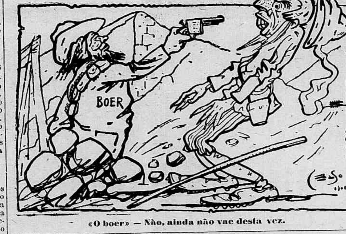
«O boer» — Não, ainda não vai desta vez.